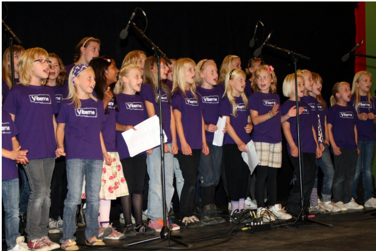
En af gaverne var en sang fra "Viberne" (Viby Friskole).

Vi fik også mange flotte gaver bl.a. store pengebeløb fra Kirkens Genbrug og ikke mindst VSA (Viby Støtteforenings Aktivitetsfond af 26. marts 1988). Gaverne vil hovedsageligt blive brugt til ungdomsarbejdet i Viby IF.